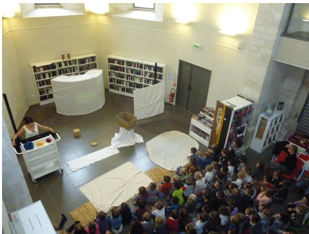
Simplicité et jeu, les maîtres-mots de ce spectacle

un tabouret, un panier à linge dans lequel se trouve un autre panier, renfermant lui-même les premières couleurs, des draps qui délimitent l'aire de jeu, une ribambelle de couleurs cachées sous le tabouret. Un fil à étendre le linge. Une table à repasser. La musique quasi permanente maintient une atmosphère irréelle.